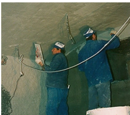
Aplicación de VANDEX REFURBISHMENT PLASTER blanco con una cpa de palustre de acero