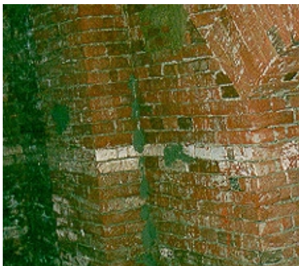
Se quita el enlucido dañado y se sanean las juntas antes de aplicar VANDEX ANTI NITRATE