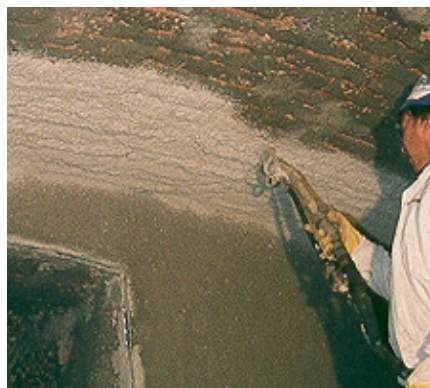
Aplicación en spray de VANDEX REFURBISHMENT PLASTER BLANCO