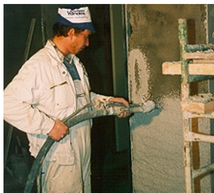
Aplicación en spray de VANDEX REFURBISHMENT PLASTER blanco en superficie vertical