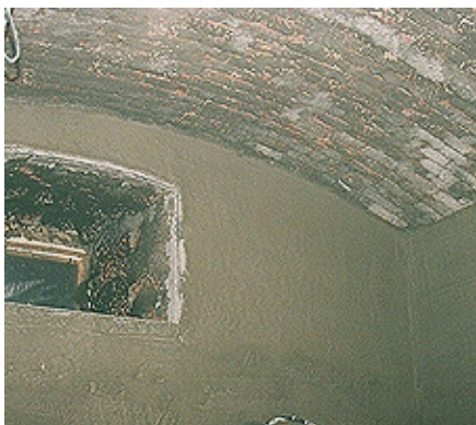
Aplicación en spray de VANDEX LEVELLING PLASTER 13.5kg/m 2