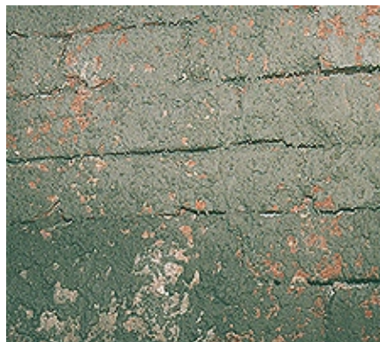
Aplicación fresca de VANDEX ROUGH CAST cubriendo el 50% de la superficie